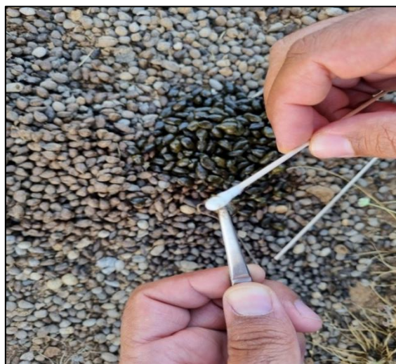
شکل ۲. نمونه‌برداری غیر تهاجمی به روش سواب از سطح سرگین‌ها