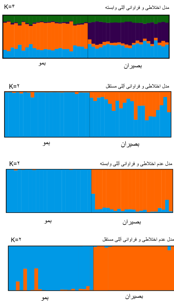
شکل ۳. ساختار بندی ژنتیکی آهوی گواتردار در استان فارس بر اساس مدل پریچارد و در نظر گرفتن سناریوهای مختلف